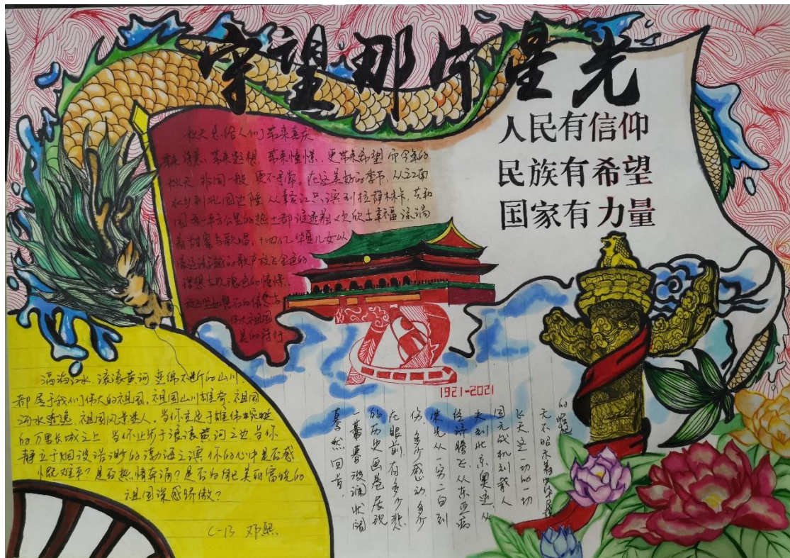
图片 6：学生电子贺卡作品