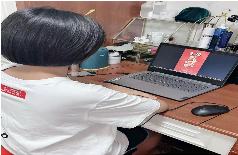
图片 2：2021 年 10 月 1 日上午，学生参加线上“向国旗敬礼”签名寄语活动。